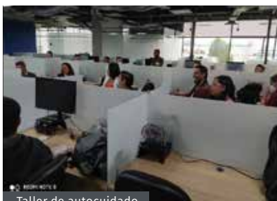
Taller de autocuidado