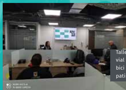
Taller de seguridad vial dirigido a bici usuarios y patinetas