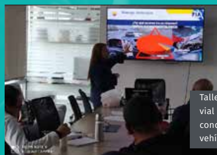
Taller de seguridad vial dirigido a conductores de vehículos