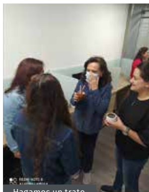
Hagamos un trato por el buen trato