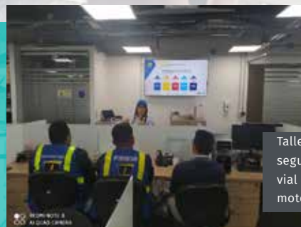
Taller de seguridad vial dirigido a motociclistas