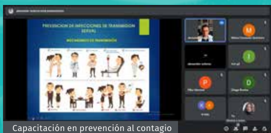
Capacitación en prevención al contagio de enfermedades de transmisión sexual